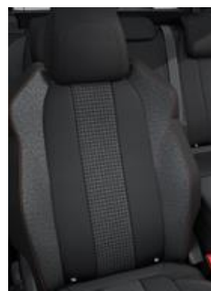
Tkanina Meco Mistral