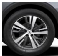
18" 'Detroit' Storm Grey