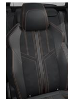
Tapicerka półskórzana Mistral + Alcantara