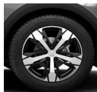
18" 'Los Angeles'