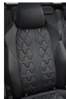
Tapicerka skórzana Nappa Mistral