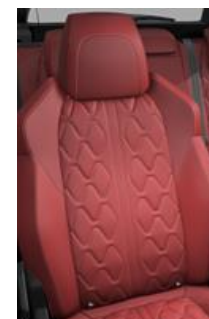
Tapicerka skórzana Nappa Rouge