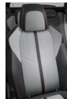
Tapicerka półskórzana Grevat + Alcantara