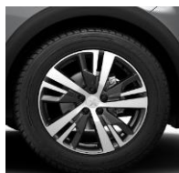
18" 'Detroit' Onyx Black