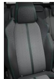
Tapicerka półskórzana Colyn Mistral