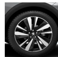
19" 'San Francisco'