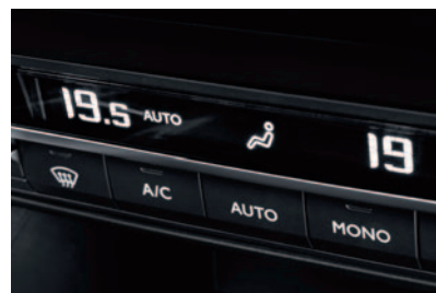
KLIMATYZACJA AUTOMATYCZNA DWUSTREFOWA + PAKIET WIDOCZNOŚĆ