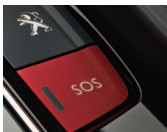
SYSTEM PEUGEOT CONNECT SOS & ASSISTANCE