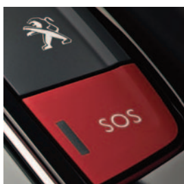
SYSTEM PEUGEOT CONNECT SOS & ASSISTANCE