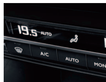
KLIMATYZACJA AUTOMATYCZNA DWUSTREFOWA