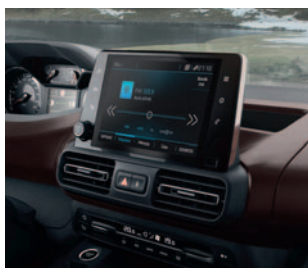
PEUGEOT CONNECT RADIO