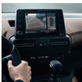
PAKIET PARK ASSIST