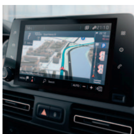
PEUGEOT CONNECT NAV DAB