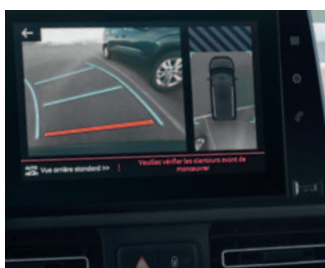
PAKIET VISIOPARK & FLANKGUARD