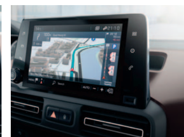
PEUGEOT CONNECT NAV DAB