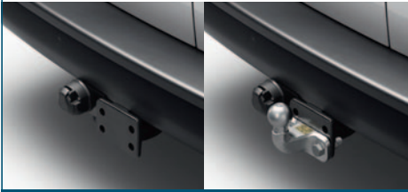
HAK HOLOWNICZY BEZ ZACZEPU / ZACZEP KULOWY