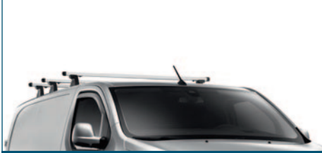
BELKA POPRZECZNA BAGAŻNIKA DACHOWEGO (POJEDYNCZA)