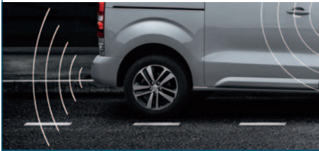
SYSTEM WSPOMAGANIA PARKOWANIA TYLNY